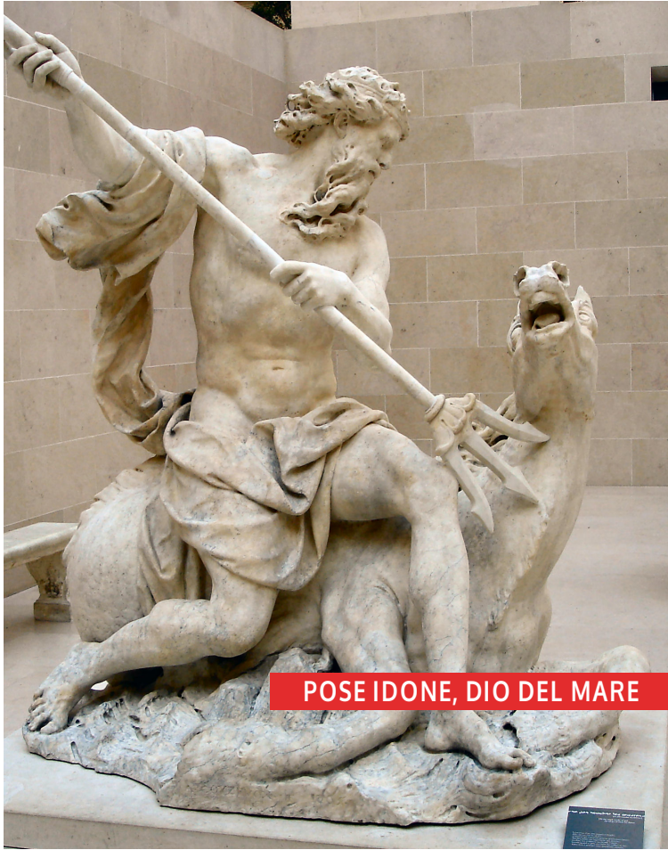
POSE IDONE, DIO DEL MARE

I racconti mitici si sviluppano in un luogo e in un tempo indefiniti I protagonisti sono divinità ed esseri soprannaturali