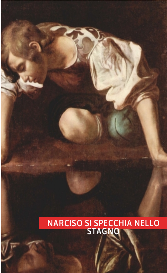
NARCISO SI SPECCHIA NELLO STAGNO

I racconti mitici furono creati per spiegare l'origine di fenomeni e per dare risposte a domande fondamentali